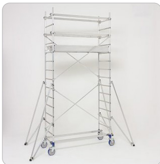
Produit livré emballé sous film PLV et notice