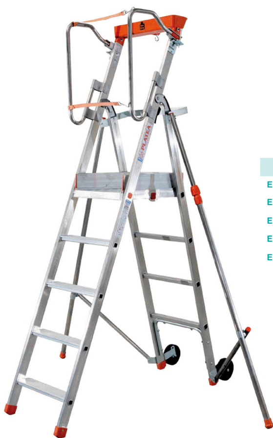
PLATE-FORME Individuelle pliante PIRL