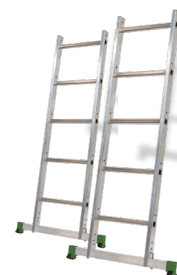
Utilisation en échelle simple