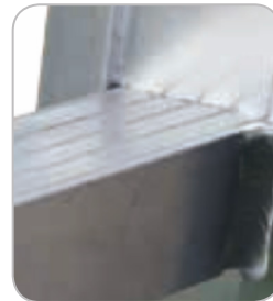
Liaison montant / échelon par sertissage et soudure supplémentaire

Recommandée pour l'entretien des plantes, jardins ou pour la cueillette des fruits.