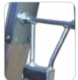
Articulation en acier très robuste